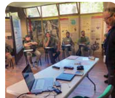
Trajnim mbi Monitorimin e Biodiversitetit

Rritja e kapaciteteve të stafit, nëpërmjet trajnimit teknik, është një burim i rëndësishëm që personeli i zyrës së menaxhimit të kuptojë MBE dhe të kontribuojë në përmirësimin e tij përmes ekspertizës dhe aftësive të tyre. Në zyrën e PKDK, ka filluar aplikimi i njohurive dhe shërbimeve teknike. Personeli është i ngarkuar me një temë të veçantë në GP bazuar në kualifikimin e tyre. Për më tepër, projekti ndihmon aplikimin e shërbimeve të reja duke përsëritur ciklin e PDCA.