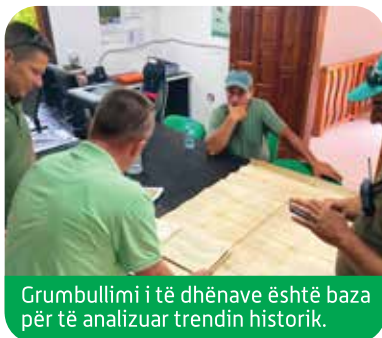
Grumbullimi i të dhënave është baza për të analizuar trendin historik.

Projekti aplikon modelin e MBE që duhet të bazohet në informacionin shkencor/ të dhënat e marra nga monitorimi i të gjitha aspekteve në parkun kombëtar Divjakë-Karavasta, si dhe ciklin PDCA mbi çështjet e nxjerra dhe, rishikimin e planit të menaxhimit në kohë. Grupet tematike të punës përfshihen në këtë proces praktikisht për të zbatuar masat të caktuara nga KM.