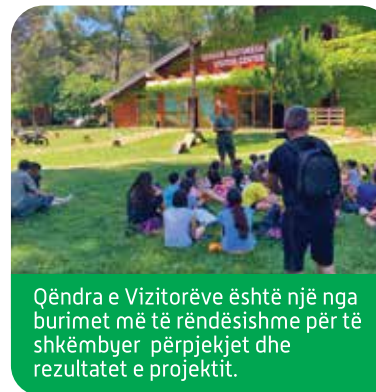
Qendra e Vizitorëve është një nga burimet më të rëndësishme për të shkëmbyer përvojat dhe rezultatet e projektit.

Ka shumë mënyra të ndryshme për përmirësimin e MBE. Gjithashtu ka edhe shumë mënyra për promovimin e shkëmbimit të përvojave praktike si brenda ashtu edhe jashtë PKDK. Përveç qëllimit të edukimit, projekti synon gjithashtu të mbledhë eksperiencat të larmishme alternative në parqet e tjera brenda dhe jashtë Shqipërisë. Projekti është i gatshëm gjithashtu për shkëmbimin e ideve dhe përvojave me praktikantët që punojnë në MBE.