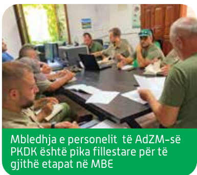
Mbledhja e personelit të AdZM-së PKDK është pika fillestare për të gjithë etapat në MBE

Administrata e Parkut është institucioni që përqëndrohet në punën për parkun. Ka burime të kufizuara, por duke rritur kapacitetin e saj koordinues, do të mund të merret me të gjitha çështjet e lidhura me Parkun Kombëtar si sekretariat i KM. Administrata e Parkut gjithashtu duket të jetë një bazë e marrëdhënieve publike duke përfshirë turizmin dhe duke bashkëpunuar me industrinë.